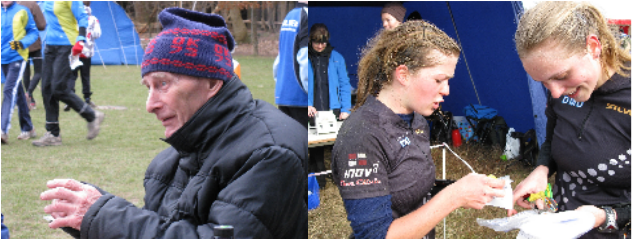
Dansk orientering favner bredt – Det skal vi blive ved med.

Dansk orientering skal være kendetegnet ved glæden. Glæden ved vores sport, uanset hvilket niveau, man dyrker orientering på. Dansk Orienterings-Forbund favner bredt. Lige fra udøvere i den absolutte verdenselite over børn og motionister til vores ældste supermotionister i klassen over 80 år. Plan 2015 skal være med til at fremme glæden ved sporten på alle niveauer – også på det organisatoriske niveau.